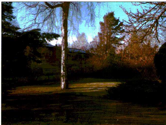
Härlig tomt för barn med benen fulla av "spring"

Svenska Mäklarhuset Vällingby, Vällingbyvägen 200 B, 162 61 Vällingby, Mäklarhuset i Vällingby AB, Tel: 08-372720, Fax: 08-870707