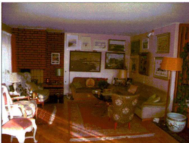
Vardagsrum i vinkel...