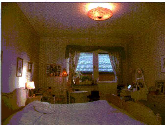
Trevligt föräldrasovrum med balkong